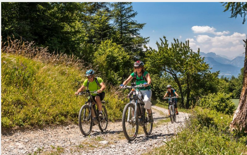
A VTT dans sur le tour du Champsaur