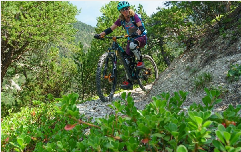
sentier en forêt d'adret