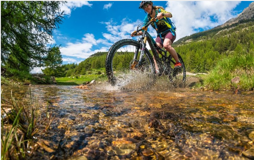
traversée torrent (rogievanrijn)