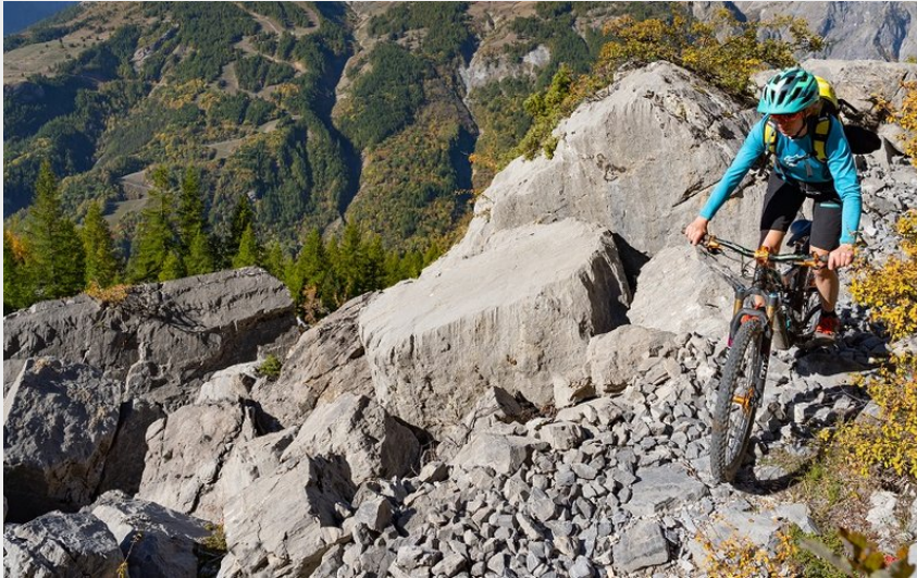
vue sur le Pelvoux (rogiervanrijn)