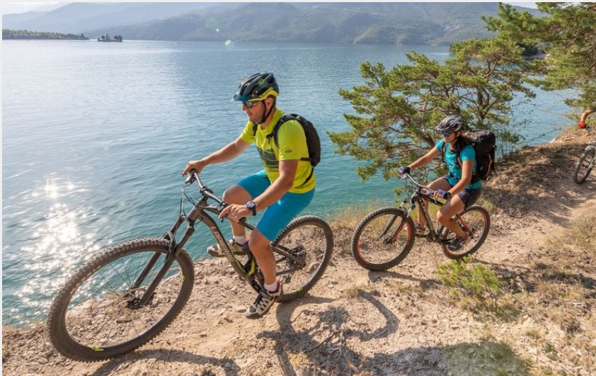
VTT Baie St-Michel