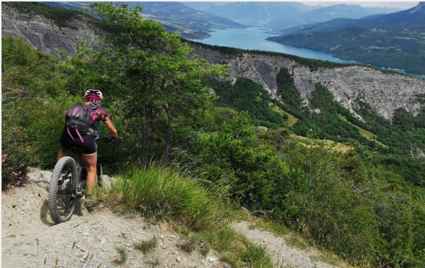
Descente sur le lac - sentier monotrace (Parc national Ecrins - E-Pedal)