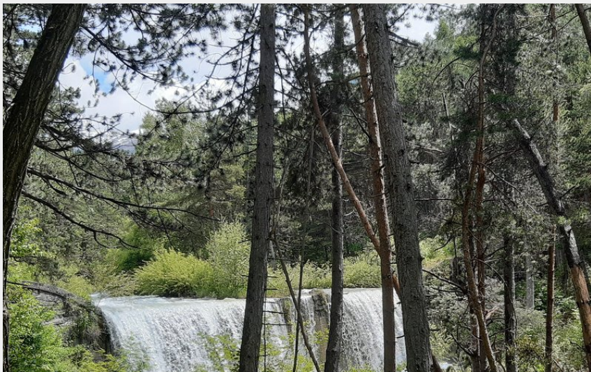
Le torrent des Vachères (florimont.tilliere)