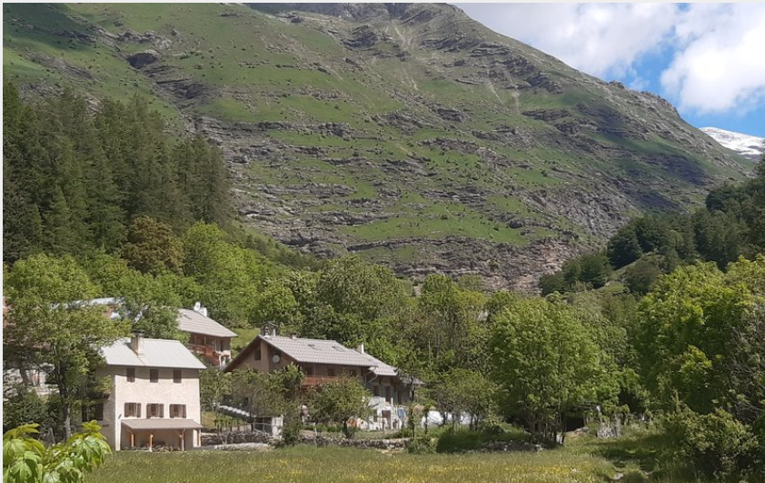
Le hameau des Gourniers (florimont.tilliere)