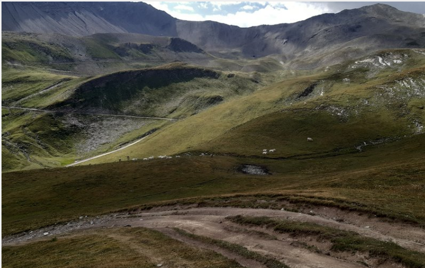
Col du Parpaillon en arrière plan (florimont.tilliere)