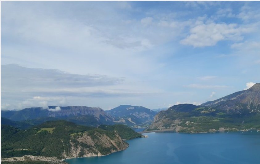
Le barrage de Serre-Ponçon (florimont.tilliere)