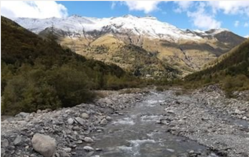
le torrent de Réallon (florimont.tilliere)