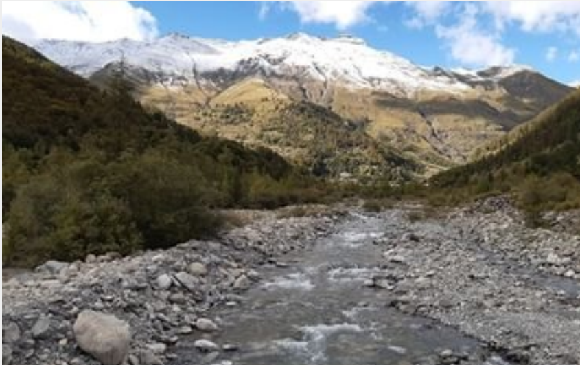
le torrent de Réallon (florimont.tilliere)