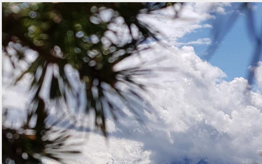
Panorama depuis le Ruban (Peudon Steven)