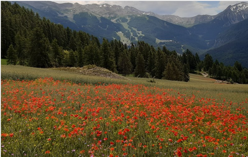
Champ de coquelicots (florimont.tilliere)