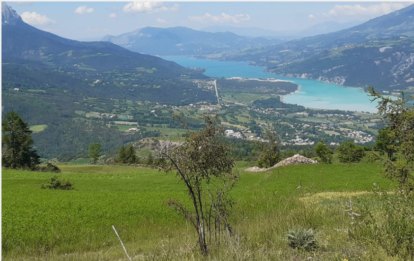
Le lac de Serre-Ponçon (florimont.tilliere)