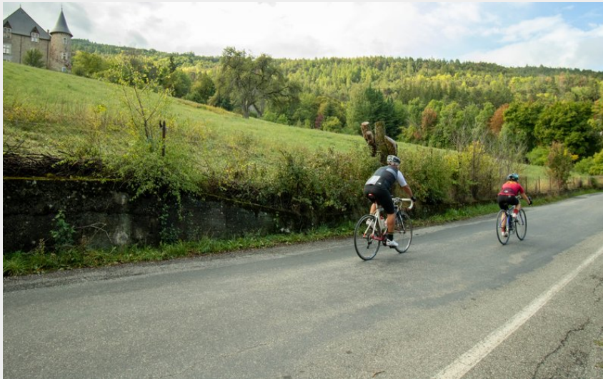
Château de Picomtal surplombant la route (Clémence DEBENATH)