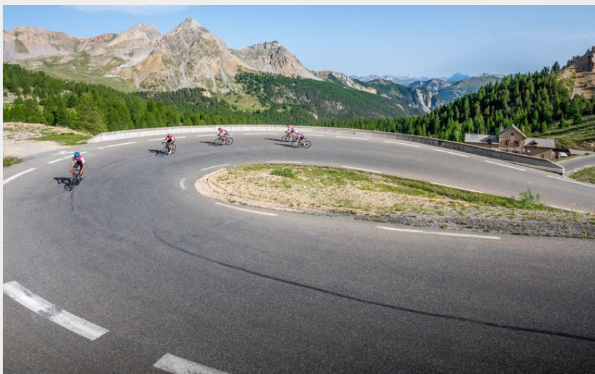
Col Izoard - Cyclisme