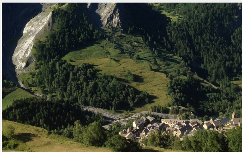
Vélo La Grave