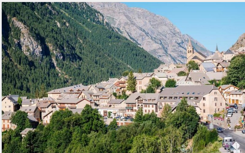
De La Grave au Col de l'Échelle_La Grave