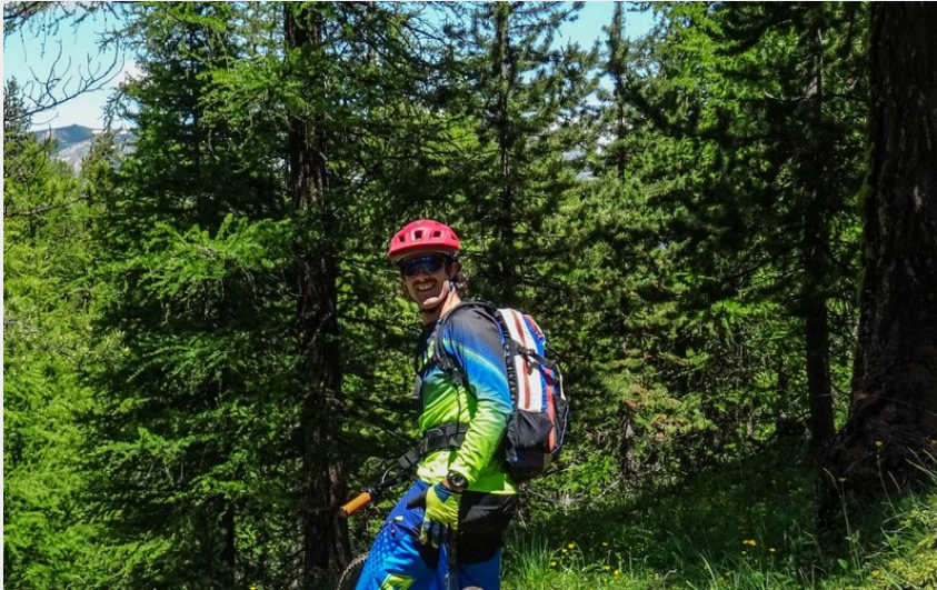
Départ du sentier de descente (M. Buffet)