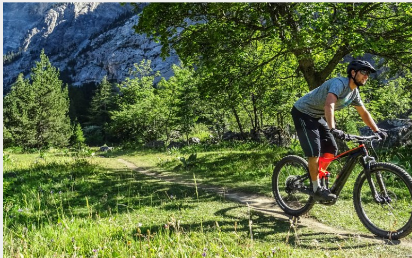
Paysage (Maxime Buffet)