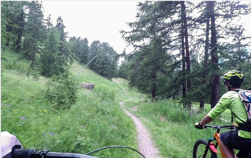
Bois de la Blanche (M. Buffet)