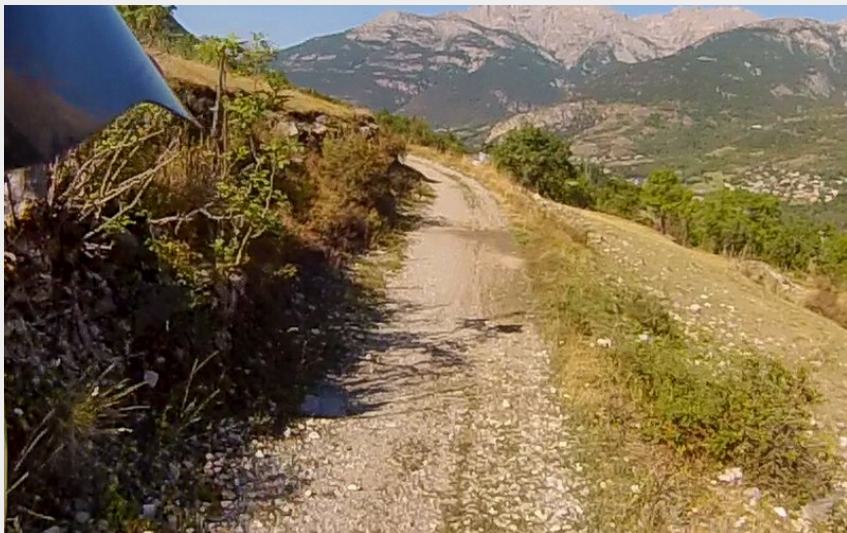
Vue sur les Tenailles de Montbrison (M. Buffet)