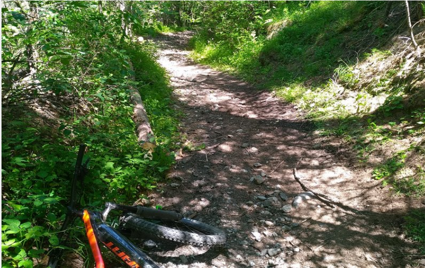
Traversée du Grand Bois du Villar (M. Buffet)