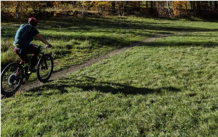
Paysage (Maxime Buffet)