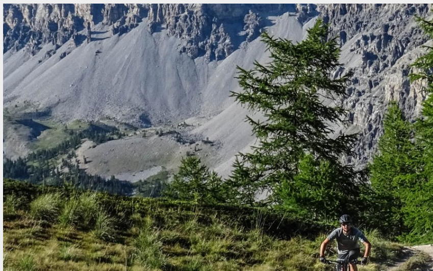
Beaux sentiers dans la Vallée Etroite (M. Buffet)