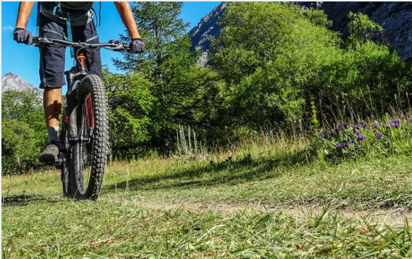
Vététiste dans la Vallée Etroite (M. Buffet)