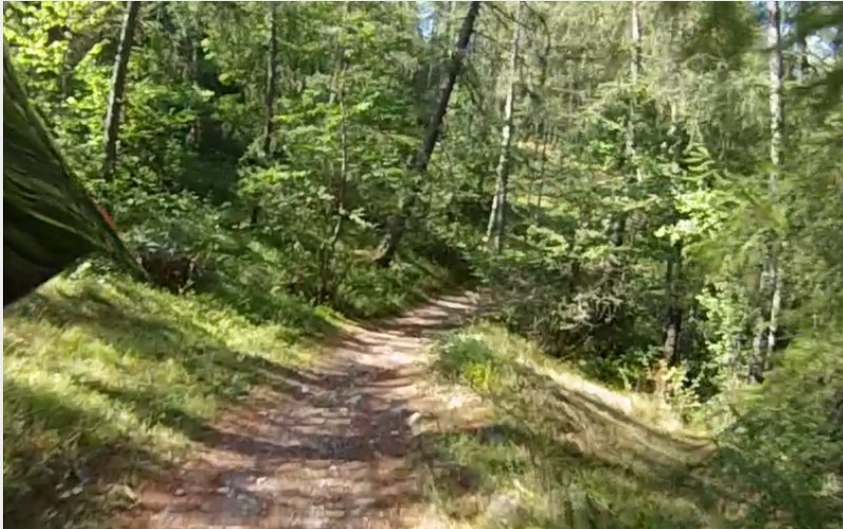
Sentier descendant le long de la Guisane (M. Buffet)