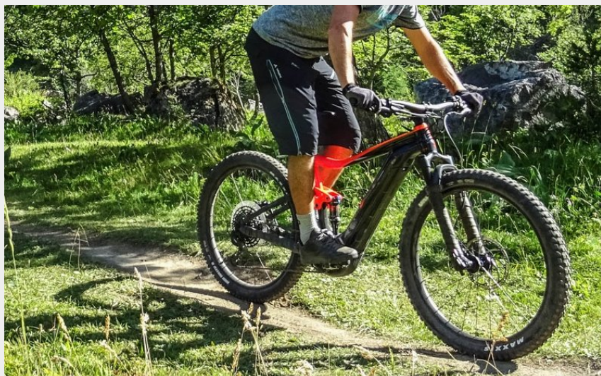
Ombre et soleil le long de la Romanche (M. Buffet)