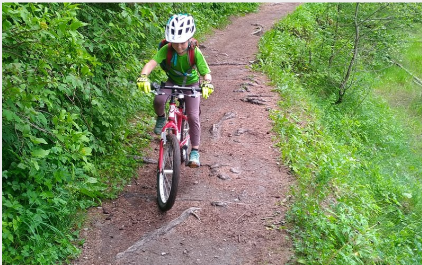
Exploration des bons sentiers de la Guisane (M. Buffet)