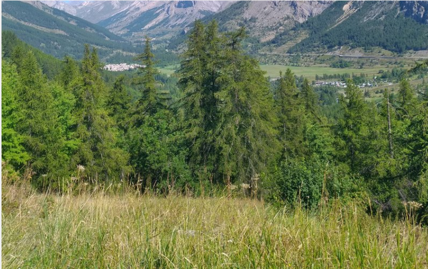
Le col du Lautaret vu depuis la vallée (M. Buffet)