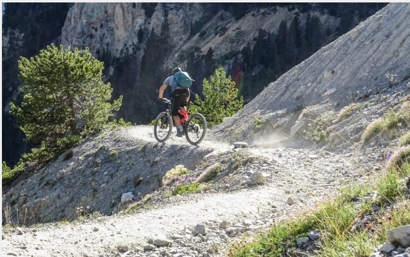
Paysage (Maxime Buffet)