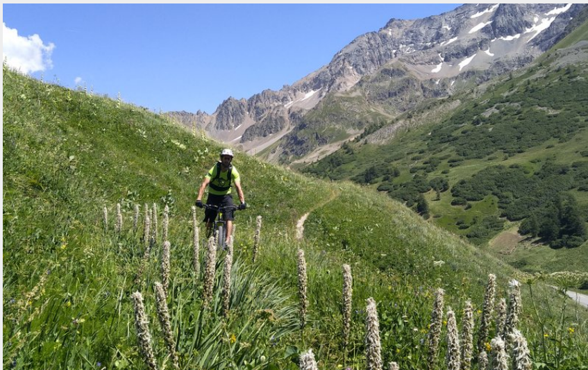
Descente du Col du Lautaret (M. Buffet)