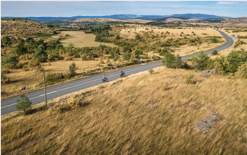
Le Larzac