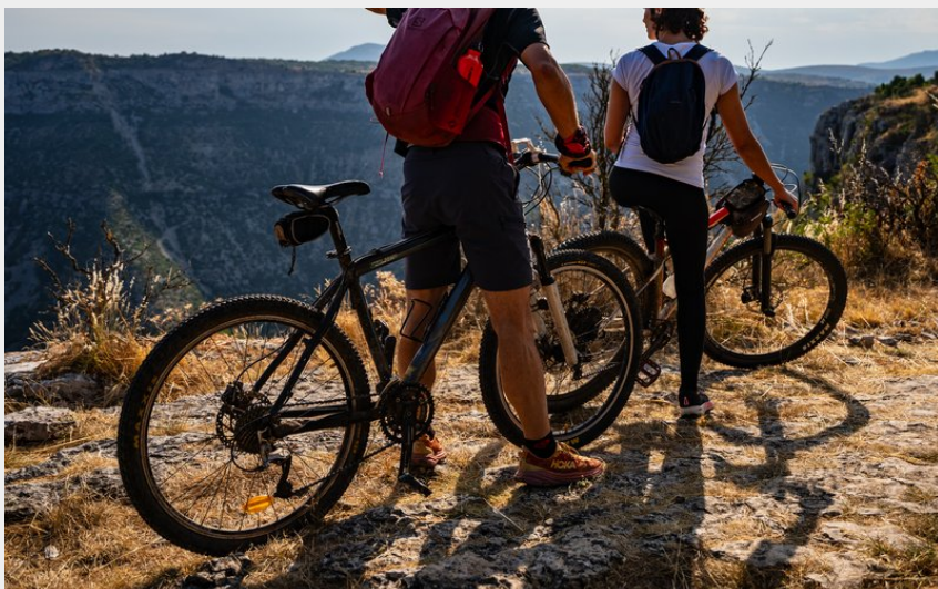
vttistes - Navacelles (Rodolphe Travel - Vitinova)