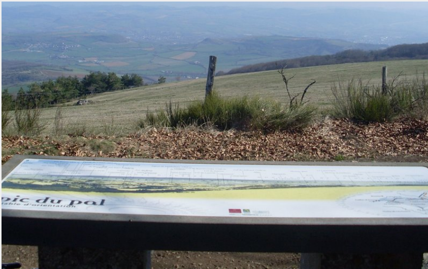
Vue depuis le Pic du Pal en Lévézou