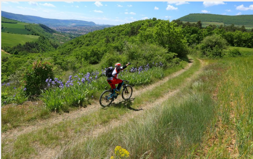
Entre pistes et singles, vues imprenables