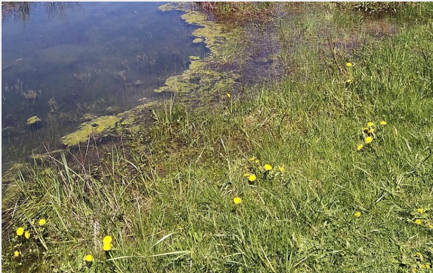
Mares des Condamines (JA PNRGC)