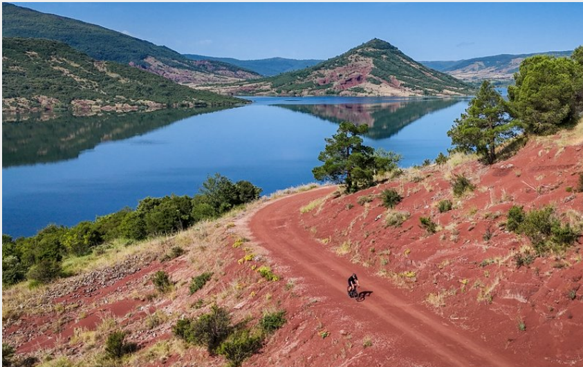
sur les bords du lac du salagou