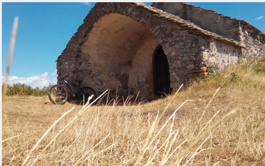
Chapelle St Amans