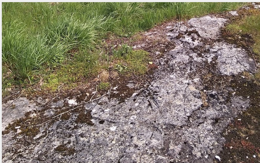
VTTiste et Lavogne (JA PNRGC)