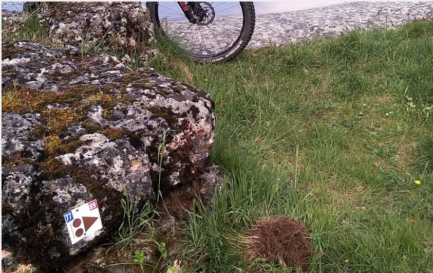
VTT et Lavogne (JA PNRGC)