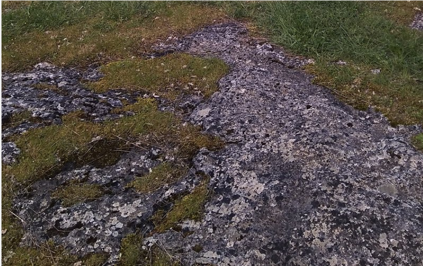
VTTiste et Lavogne (JA PNRCG)