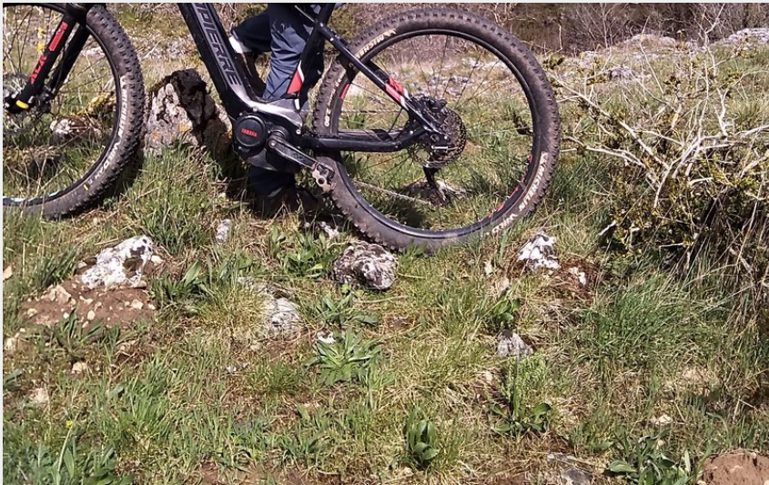
VTT et Paysage (JA PNRGC)