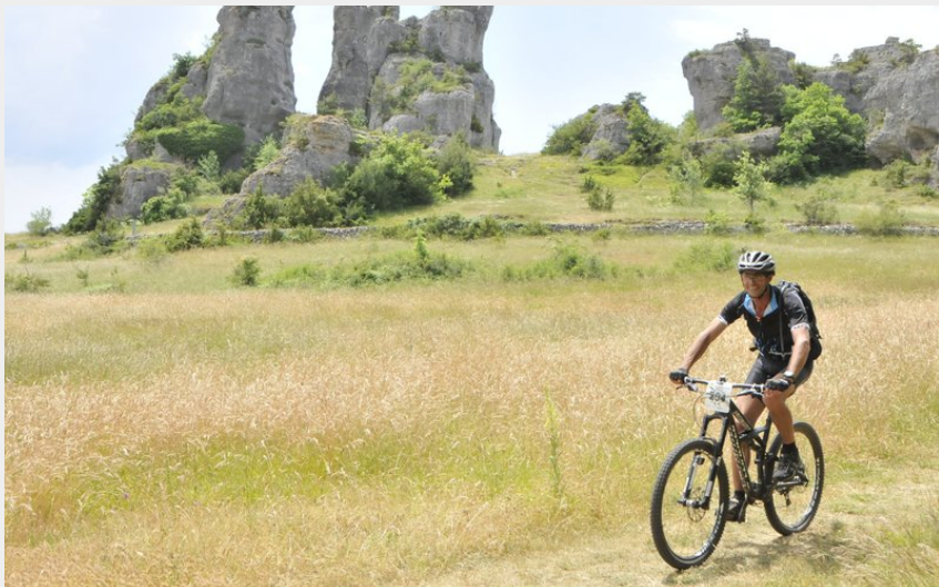
A coeur des chaos de Roquesaltes (La Caussearde)