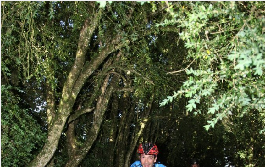
En parlant de buissière... (Caussearde)