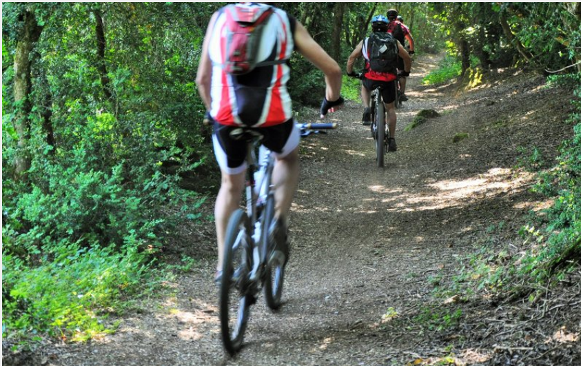
Dans les buissières du Larzac (La Caussearde)