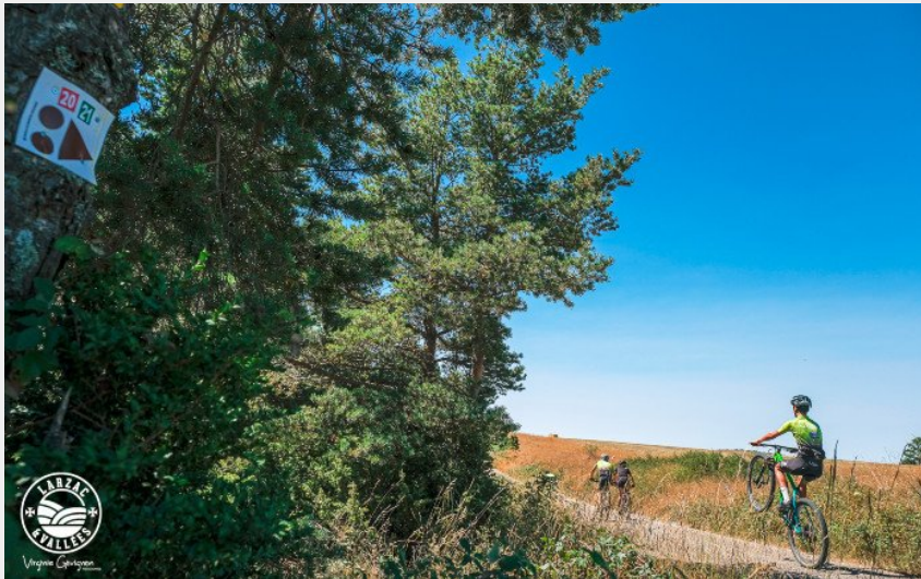
Sur le causse bégon...