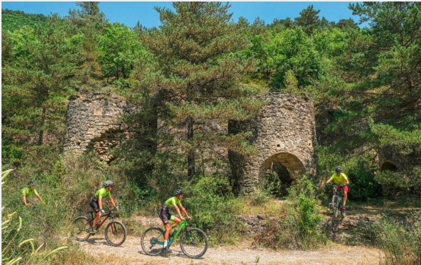
Les fours à calamines dans le ravin des Valettes