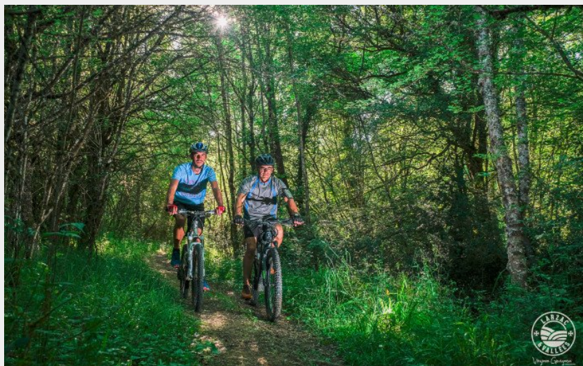
Le long du Durzon...